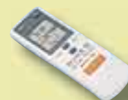
afstandsbediening (optie vaste bediening)